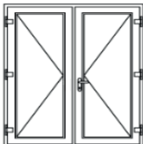
Parvekkeen pariovi (PPO)